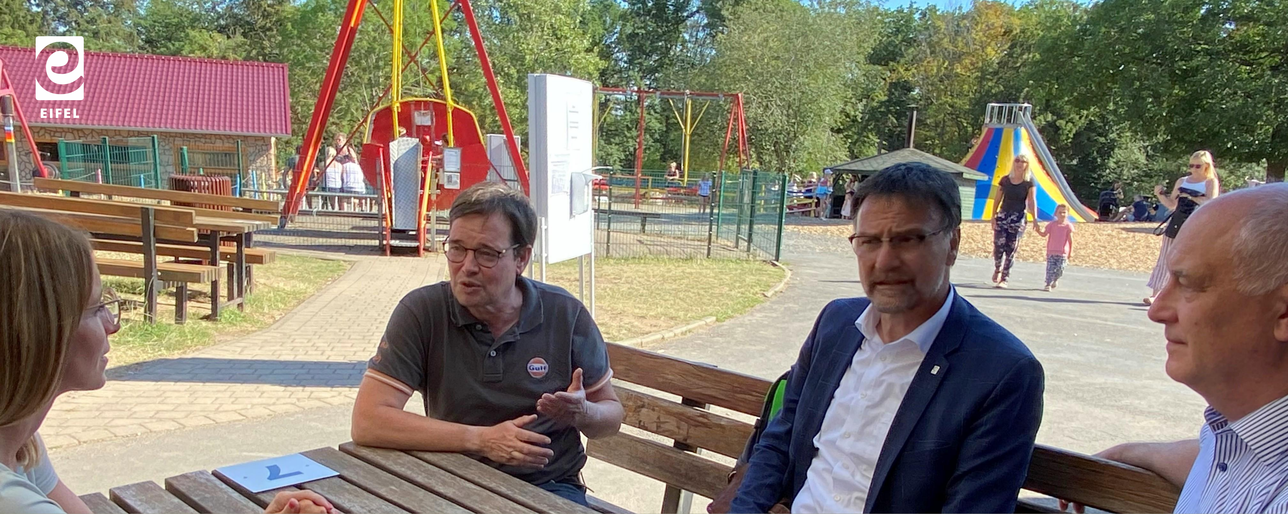
Infotour Aufsichtsratsvorsitzender Landrat Heinz-Peter Thiel Sommer 2020