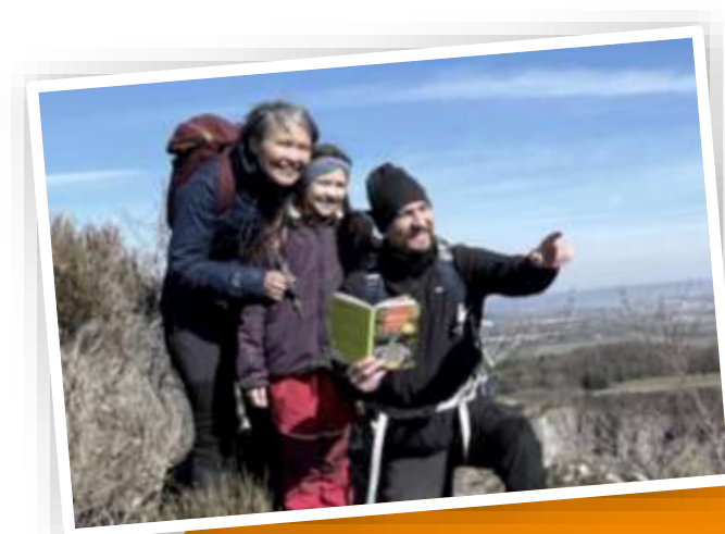
Familie & Karriere